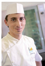
Recette proposée par Arnaud Jacques